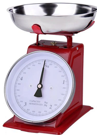
FIGURE 1 – Balance de cuisine

Une balance de cuisine est un accessoire indispensable afin de doser les ingrédients à mettre dans une recette.