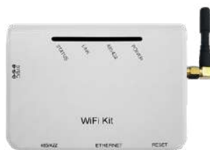
Datalogger serie Easy