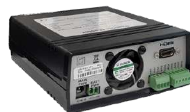
Datalogger serie Professional