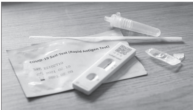
[ଚିତ୍ର- 11.4 ] ରାପିଡ୍ ଆଣ୍ଟିଜେନ୍ ଟେଷ୍ଟ କିଟ୍

ତୁରିତ ଆଣ୍ଟିଜେନ୍ ନିଦାନ (RAT) : ଏହି ପରୀକ୍ଷା ପାଇଁ ଏକ ସଂଗ୍ରହ ନଳୀରେ ବଫର୍- (Buffer) ଦ୍ରବଣ ଯୋଗ କରାଯାଏ । ତା’ପରେ ନାକ ସନ୍ଧିର ସ୍ଵାବ୍ ନିଆଯାଇ ସେହି ବଫର୍ ଦ୍ରବଣରେ ମିଶାଇ ଦିଆଯାଏ । ସେହି ମିଶ୍ରଣରୁ ମାର୍ଗଦର୍ଶିକା ଅନୁସାରେ 2 - 5ଟି ବୁଦାକୁ ଏକ ପରୀକ୍ଷଣ ପାତ୍ର- (Test device) ର ଗର୍ଭ ଭଳି - (Well) ଅଂଶରେ ଯୋଗ କରାଯାଏ । 15 ମିନିଟ୍ ପରେ ସ୍ଵାବ୍ ନମୁନାଟି କୋଭିଡ୍ ପଜିଟିଭ୍ ବା ନେଗେଟିଭ୍ ସୂଚନା ଦିଏ । (ଚିତ୍ର-11.4)