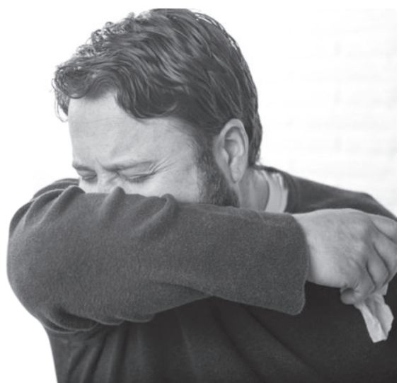
[ ଚିତ୍ର- 11.2 ] ଛିଙ୍କିବାର ଉପଯୁକ୍ତ ଉପାୟ

କୋଭିଡ୍-19 କୁ ସୀମାବନ୍ଧ କରିବା ପାଇଁ ପାଞ୍ଚଟିରୁ ଶେଷ ଦୁଇଟି ଉପାୟକୁ ସବୁ ବର୍ଗରେ ପାଳନ କରାଯିବା ଆବଶ୍ୟକ । କୋଭିଡ୍ ସଙ୍ଗତ ଉପାୟଗୁଡ଼ିକ ହେଲା- ସବୁବେଳେ ମାସ୍କ ପିନ୍ଧିବା, ପରସ୍ପରଠାରୁ 2 ମିଟର ଦୂରତା ରଖିବା, ଜନସମାଗମ ହେଉଥିବା ସ୍ଥାନକୁ ଅନାବଶ୍ୟକ ଭାବେ ନ ଯିବା, ହାତକୁ ବାରମ୍ବାର ଧୋଇବା ବା ବିଶୋଧକ ବ୍ୟବହାର କରିବା, ଛିଙ୍କିବା ସମୟରେ କହୁଣ୍ଡିରେ ମୁହଁକୁ ଢାଙ୍କି ତଳକୁ ମୁହଁ କରି ଛିଙ୍କିବା । (ଚିତ୍ର-11.2)