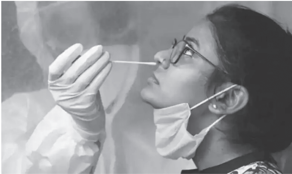
[ଚିତ୍ର- 11.3(a)] ନାସାରନ୍ତରୁ କୋଭିଡ୍ -19 ନିର୍ଣ୍ଣୟ ପାଇଁ ନମୁନା ସଂଗ୍ରହ

ବିଜ୍ଞାନଗାରରେ ପ୍ରସ୍ତୁତ କରାଯାଇଥିବା ଗୋଟିଏ ଟୀକାକୁ ସାର୍ବଜନୀନ ଟୀକାକରଣ କାର୍ଯ୍ୟକ୍ରମରେ ନିୟୋଜିତ କରିବା ପୂର୍ବରୁ ଅତି କମ୍ରେ ପାଞ୍ଚୋଟି ସୋପାନ ଅତିକ୍ରମ କରିବାକୁ ପଡ଼େ । ଏହି ସମୟ ମଧ୍ୟରେ ଟୀକାର ନିରାପତ୍ତା, ପ୍ରଭାବ ଓ ରୋଗପ୍ରତିରୋଧକ କ୍ଷମତାକୁ ତଦନୁତନ କରି ଅନୁଧ୍ୟାନ କରାଯାଏ । ଏହି କାର୍ଯ୍ୟ ସମ୍ପନ୍ନ ହେବାକୁ ଅନେକ ମାସ ଏପରିକି ବର୍ଷାଧିକ କାଳ ଲାଗିଥାଏ । ସେହି ପାଞ୍ଚୋଟି ସୋପାନ ହେଲା— ପ୍ରାକ୍ନିଦାନିକ ପରୀକ୍ଷଣ- (Preclinical testing), ନିରାପତ୍ତା ପରୀକ୍ଷଣ- (Safety trials), ବିସ୍ତାରିତ ପରୀକ୍ଷଣ - (Expanded trials), ଦକ୍ଷତା ପରୀକ୍ଷା - (Efficacy trials) ଓ ନିୟାମକ ଅନୁମତି- (Regulatory approval) ।