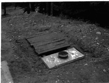
Input side manhole

No scale Tank size is approx. 4000 gallons