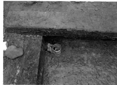
Exit to drain field