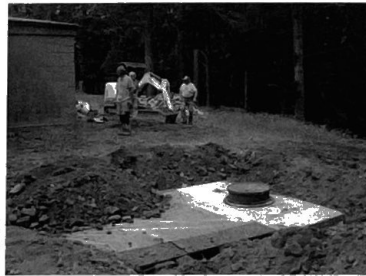
Output side manhole