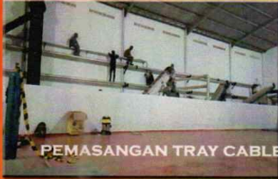
PEMASANGAN TRAY CABLE & INSTALASI PENERANGAN PRODUKSI