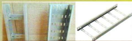
CABLE LADDER - TRAY CABLE