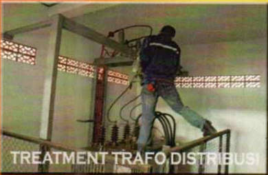
TREATMENT TRAFU, DISTRIBUSI