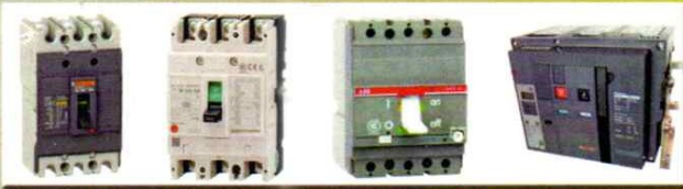
AIR CIRCUIT BREAKER - MOULDED CASE CIRCUIT BREAKER