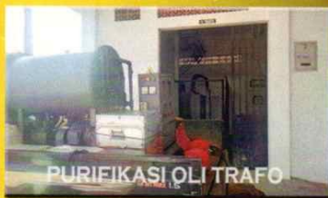
PURIFIKASI OLI TRAFU