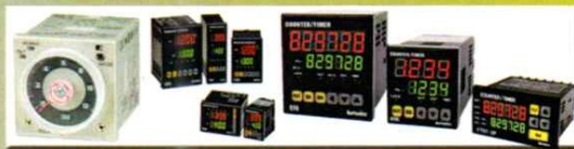
TIMER - COUNTER - TEMPERATURE CONTROLLER