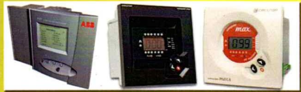
POWER FACTOR REGULATOR