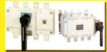
LOAD BREAK SWITCH - CHANGE OVER SWITCH