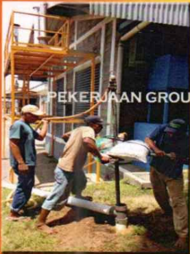
PEKERJAAN GROUNDING TRAFU, PANEL, GARDU TRAFU, INSTALASI PETIR