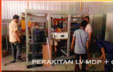
PERAKITAN LV-MDP + CAPACITOR BANK + ATS-AMF GENSET