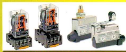
RELAY CONTROL - MICRO SWITCH