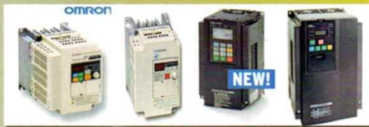
INVERTER - SOFT STARTER