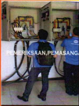
PEMERIKSAAN, PEMASANGAN INSTALASI TEGANGAN MENENGAH, TEGANGAN RENDAH SLO TM - TR