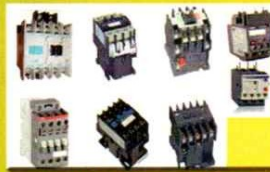
MAGNETIC CONTACTOR THERMAL OVERLOAD