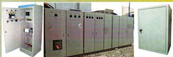
FREE STANDING - WALL MOUNTING PANEL BOX