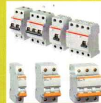
MINI CIRCUIT BREAKER