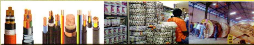
POWER CABLE - WIRING & CONTROL CABLE