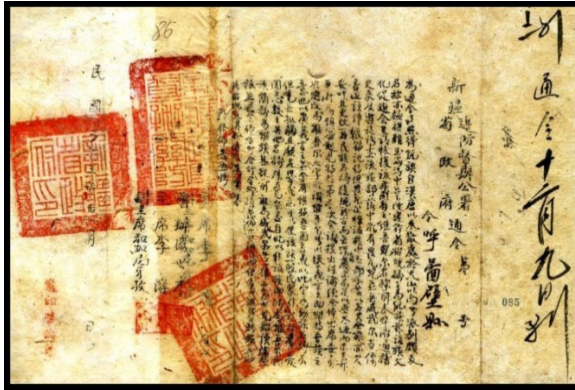
بىرىنچى رەسىم: «ئۇيغۇر» نامىنىڭ «ۋېي - ۋۇ - ئېر» غا ئۆزگەرتىلىشىگە ئائىت پەرمان.

ھەققىدىكى مىللەت ئېنىقلىمىلىرىنى قوبۇل قىلىپ - قىلماسلىقى مۇھىم ئورۇندا تۇرىدۇ.