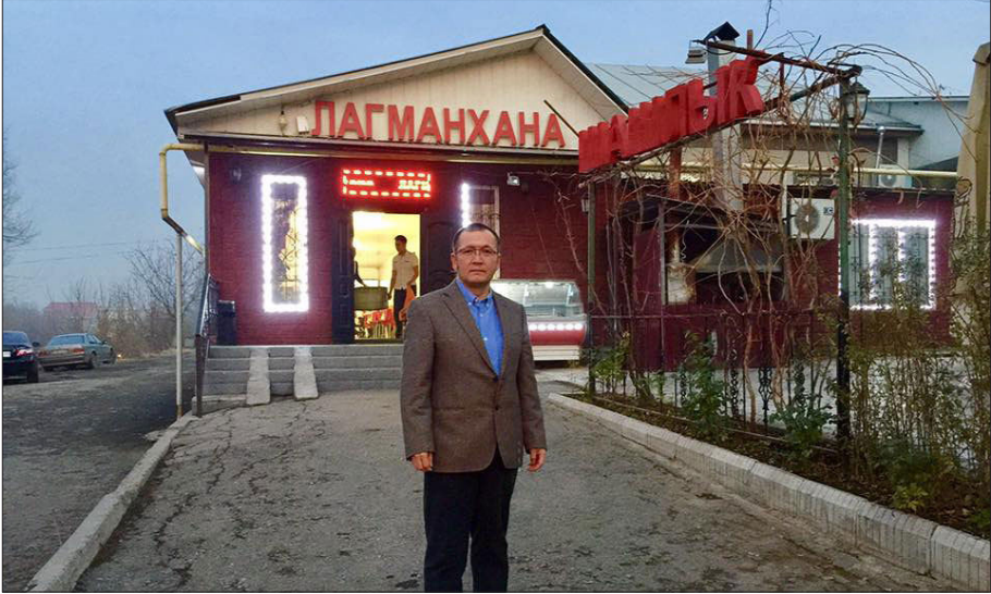
1.8 - رەسىم: ئالمۇتىدىكى بىر لەغمەنخاناغا زىيارەت.

دۇنيانىڭ ھەر قايسى رايون ۋە ئەللىرىدىكى لەغمەنخانلارنىڭ كۆرۈنۈشلىرى: