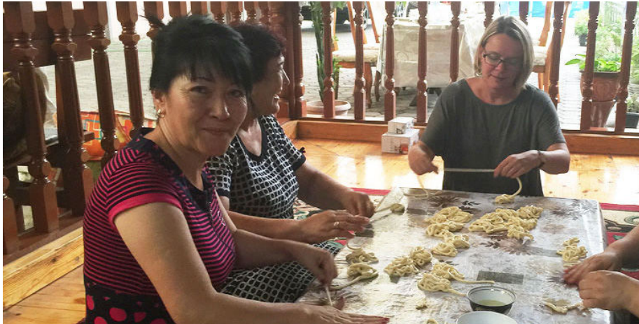
2.11 - رەسىم: ئالمۇتىنىڭ سۇلتان قورغاندىكى بىر ئۇيغۇر ئائىلىسىدە ئاياللار لەغمەن چۆپىنى ئەشمەكتە. (2016 - يىلى، ئىيۇل)