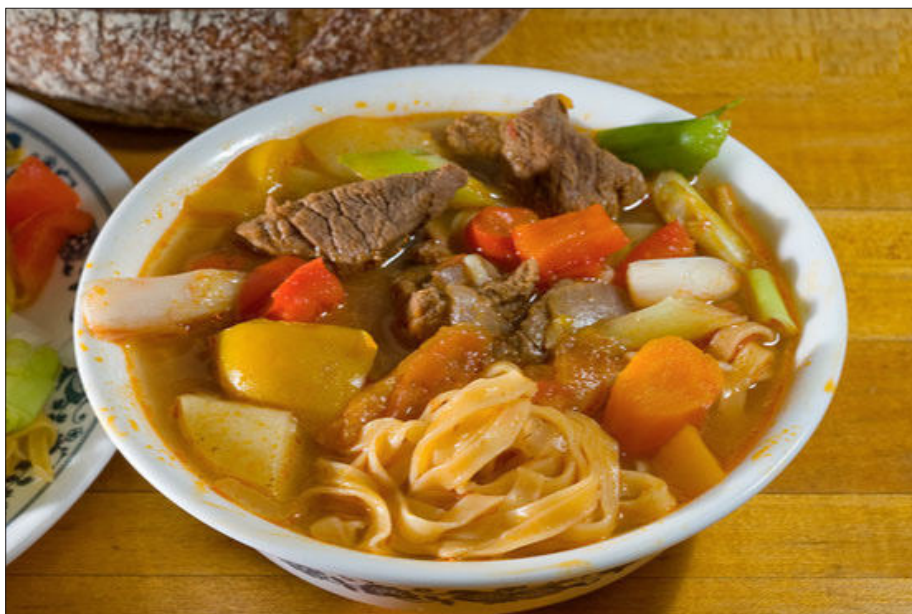
3.7 - رەسىم: بۇخارا لەغمىنى by Skipper