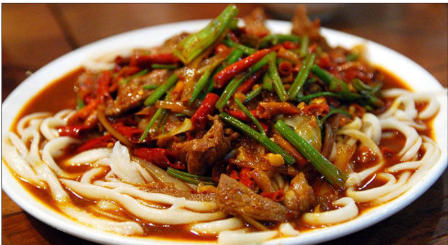
1.7 - رەسىم: ئۈرۈمچى لەغمىنى

دۇنيانىڭ ھەر قايسى جۇغراپىيەلىك رايون ۋە ئەللەردىكى لەغمەننىڭ كۆرۈنۈشلىرى: