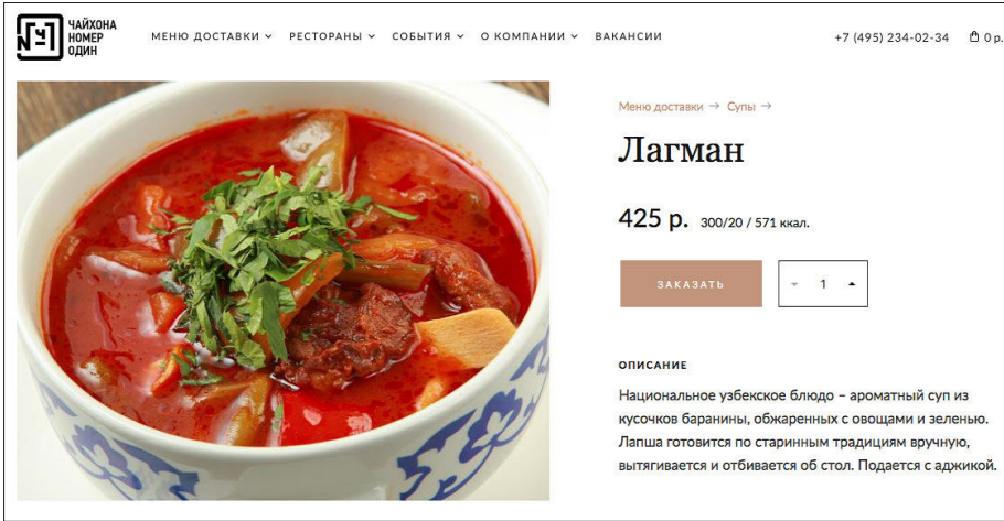
4.7 - رەسىم: موسكۇلا لەغمىنى

بۇ يەردە ئوتتۇرا ئاسىيادىن تاشقىرى جاھانغا تونۇلۇۋاتقان ئۇيغۇر لەغمىنى ھەققىدە تولۇقلاپ ئۆتۈش زۆرۈر بولغىنى ئۇيغۇرلارنىڭ ئۆزلىرى ئەڭ كۆپ ئىستېمال قىلىدىغان «لەغمەن» ناملىق بۇ تامىقىنى ئوتتۇرا ئاسىياغا تونۇشتۇرۇش بىلەنلا چەكلىنىپ قالماستىن يېقىنقى ئون نەچچە يىللاردىن بۇيان ياۋروپا، ئامېرىكا ۋە ئوتتۇرا شەرق ئەللىرىگىمۇ تونۇتۇشقا باشلىغان. ئوتتۇرا ئاسىيا بىلەن رۇسىيەنىڭ سىرتىدا ئۇيغۇر لەغمىنىنى ئۆز ئىچىگە ئالغان ئۇيغۇر تائاملىرىنىڭ تونۇلۇشىدا ئۈرۈمچىدە يېمەك - ئىچمەك تىجارىتى ساھەسىدە مۇۋەپپەقىيەت قازانغان ۋە تەرەققىي قىلىپ ئۇيغۇر ئاپتونوم رايونىنىڭ سىرتىدا دادىل تىجارەت قىلىشنى باشلىغان «ھەرەمباغ» قاتارلىق ئۇيغۇرلار ئىگىلىكىدىكى مۇۋەپپەقىيەت قازانغان چوڭ تىجارىي كارخانىلار ئاساسلىق رول ئوينىغان بولسا، يەنە بىرى ئۇيغۇرلارنىڭ يېقىنقى يىگىرمە يىللاردىن دۇنيانىڭ ھەر قايسى ئەللىرىگە كېلىپ تىجارەت قىلىشى، كۆچمەن بولۇپ ئولتۇراقلىشىشى قاتارلىق تۈرلۈك ئامىللار ھەم مۇھىم رول ئوينىغان.