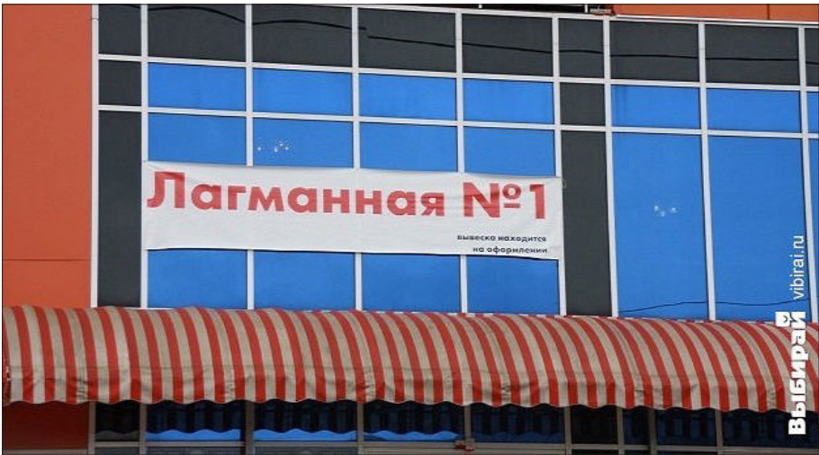
2.9 - رەسىم: موسكۋادىكى «1 - نومۇرلۇق لەغمەنخانا» نىڭ كۆرۈنىشى.