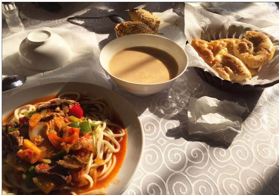
2.7 - رەسىم: غۇلجا لەغمىنى

ئوتتۇرا ئاسىياغا لەغمەن بىلەن تونۇلۇۋاتقان ئۇيغۇرلار