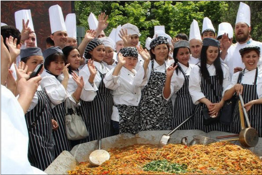
2. رەسىم: ئالمۇتا ئۇيغۇر تىياتىرنىڭ ئالدىدا تەييارلانغان دۇنيادىكى ئەڭ چوڭ لەغمەن .

خەۋەردە ئېيتىلىشىچە بۇ زور كۆلەمدىكى لەغمەن ئېتىش پائالىيىتىنى ئالمۇتدىكى ئۇيغۇر تىياتىرنىڭ ئالدىدا قازاقىستان مۇستەقىللىق كۈنىدە قازاقىستان جۇغراپىيە جەمئىيىتى قۇرۇلغانلىقىنىڭ بەش يىللىقىغا ئاتاپ ئورۇنلاشتۇرۇلغان. بۇ ناھايىتى زور بىر داشقازاندا ئېتىلگەن لەغمەننىڭ ئومۇمىي ئېغىرلىقى 687 كىلوگرامدىن ئارتۇق بولۇپ، 30 دىن ئارتۇق ئاشپەز تائامنى تەييارلىغان. لەغمەن ئېتىلىۋاتقان يەرگە دۇنيادىكى ئەڭ زور لەغمەننى كۆرۈش ئۈچۈن كەلگەن كىشىلەرگە بۇ بىر قازان لەغمەن بۆلۈپ بېرىلگەن. شۇنداقلا بۇ غايەت زور ئېغىرلىقتىكى بىر قازان لەغمەن دۇنيا جېنىس رېكورتى قامۇسىغا كىرگۈزۈلگەن. (8) دېمەك ئۇيغۇرلار قازاق ئېلىدە لەغمەننى بىلەن تونۇلغان!