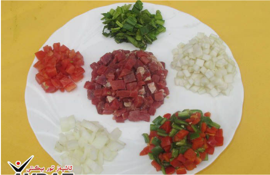
1.10 - رەسىم: لەغمەن قورۇمىسىنىڭ كېرەكلىك خام ماتېرىياللىرى

چۆپ پىشقاندىن كېيىن سوزۇپ ئېلىپ، سوغۇق سۇدا چايىقاپ، ئاندىن ئاش ئىسسىتىپ ياكى شۇ پېتىچە چىنلەرگە ئېلىپ ئۈستىگە تەييارلانغان قورۇمىسىنى قويۇپ ئىستېمال قىلىمىز. (35)