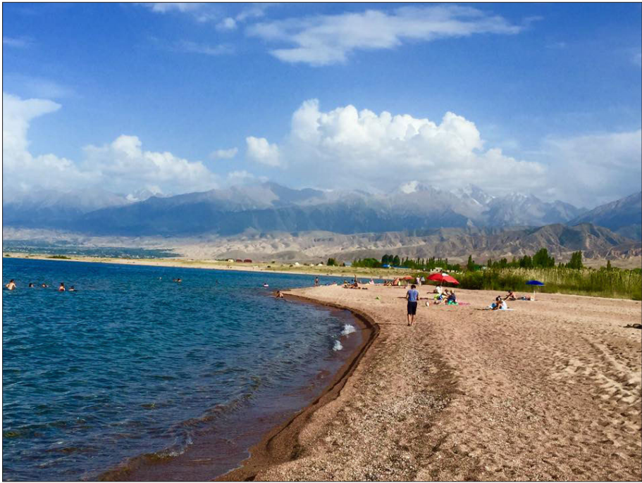
3-رەسىم: تەڭرىتېغىنىڭ كۆزى - ئىسسىق كۆل مەنزىرىسى

ھەممىسى مۇشۇ ئائىلىۋى ئارامگاھىغا كېلىپ، ئاتا - ئانىسىغا ياردەملىشىدىكەن. بىر كۈنى كەچلىك تاماق ۋاقتىدا خوجايىنىنىڭ چوڭ قىزى راۋان ئىنگىلىزچە سۆزلەپ بىزنى قىزغىن كۈتۈۋالدى. چىنارا (15) بىشكەكتىكى مەلۇم ئۇنىۋېرسىتېتنىڭ ئىنگىلىز تىلى ئوقۇتقۇچىسى بولۇپ خىزمەت قىلىدىكەن. بىر كۈنى كەچلىك تاماق ۋاقتىدا چىنارا قىرغىزچە ئۇسلۇبتا تەييارلانغان سۇلۇق لەغمەن بىلەن نان، مېۋە - چېۋىلەر ۋە چاي قاتارلىق يېمەك - ئىچمەكلەرنى پەتنۇستا ئالدىمىزدىكى شىرەگە كەلتۈرۈشكە باشلىدى. بىزمۇ تاماقلارغا ئېغىز تەگكەچ بۇرۇنقىغا ئوخشاشلا تاغدىن - باغدىن پاراڭلىرىمىزنى باشلىۋەتتۇق.