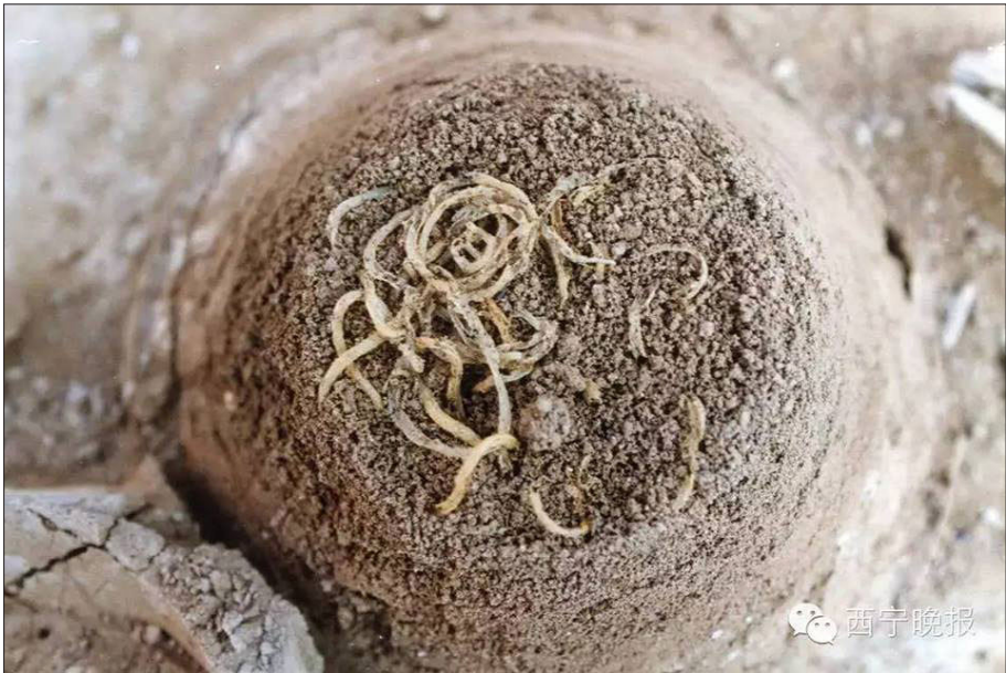
6- رەسىم: چىڭخەيدىن تېپىلغان 4000 يىل بۇرۇنقى لەغمەن .

ئەجدادلىرىمىز تارىختا چارۋىچىلىقنى ئاساس قىلغان كۆچمەن يايلاق ھاياتىدىن تەدرىجىي ھالدا چارۋىچىلىق ۋە دېھقانچىلىقنى بىرلەشتۈرگەن تۇراقلىق ھايات مۇھىتىغا تەخمىنەن 5000 يىللار ئەتراپىدا كۆچكەنلىكىنى ۋە شۇنىڭدىن باشلاپ بۇغداي زىرائەتلىرىنى تېرىپ ئاشلىق ئورنىدا ئىشلەتكەنلىكى، نان ۋە چۆپ قاتارلىق خېمىر بىلەن ھازىرلىنىدىغان تاماقلار بىلەن ئوزۇقلانغانلىقىنى ھازىرغا قەدەر ئۇيغۇرلار ياشاپ كەلگەن كەڭ زېمىنلاردىن تېپىلغان يادىكارلىقلار ئىسپاتلاپ تۇرۇپتۇ. (22)