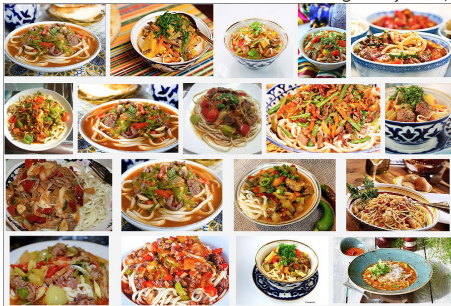
15. لەغمەننىڭ تۈرلۈك شەكىلدىكى كۆرۈنۈشلەرى.

يەنە بىر نۇقتىدىن ئېيتقاندا گەرچە ئۇلار ئارىسىدىكى تائاملاردا قىسمەن پەرقلەر بار بولسىمۇ بىراق بۇ پەرقلەر ئومۇمىي تۈركى مىللەتلەر تائام مەدەنىيەت ئەنئەنىسى رامكىسى ئىچىدىن تۈپتىن ھالقىپ چىقىپ كەتمىگەن. بۈگۈنكى كۈندە ئۇيغۇر لەغمىنى ئۇيغۇر دىيارىدا، ئىچكىرى خىتاي ئۆلكىلىرىدە ۋە ئوتتۇرا ئاسىيا دۆلەتلىرىدە بولسۇن بىردەك ياكى پەرقلىق ھالدا ئۇيغۇرلارنىڭ تائامى دەپ قارىلىپ كەلمەكتە. بولۇپمۇ ئوتتۇرا ئاسىيا دۆلەتلىرىدە، ھەتتا رۇسىيەدە بۇ تائامنى «ئۇيغۇر لەغمىنى» نامى بىلەن ئاتاش خاس بىر تائام ئىسمىغا ئايلانغان بولۇپ، بۇ ئارقىلىق لەغمەن ئىگىسىنىڭ ئۇيغۇر خەلقى ئىكەنلىكى ئېنىق شەرھلەنگەن. ■