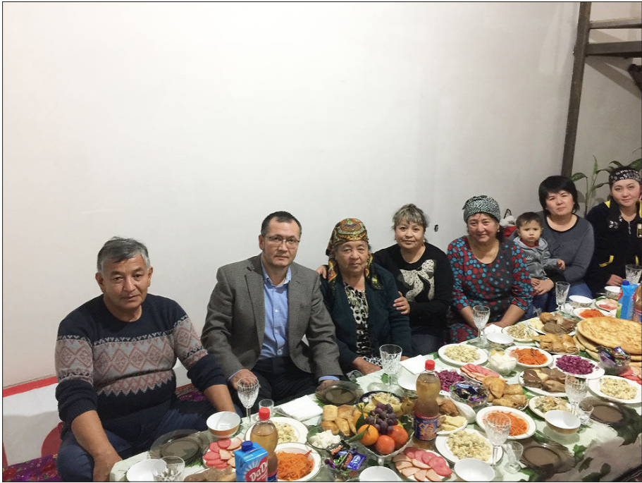
1. رەسىم: ئالمۇتا شەھىرىنىڭ شىمالى قىسمىغا جايلاشقان بورالتاي боралтай مەھەللىسىدىكى ئۇيغۇر جامائىتى بىلەن بىرگە.

مەن قازاقىستانغا 2003 - يىلى تۇنجى قېتىم بارغاندىن بۇيان بىر قانچە قېتىملاپ بۇ ئەلدە زىيارەت ۋە خىزمەت سەپەرلىرىدە قىسقا ۋاقىت بولدۇم. مەن 2003 - يىلى ئالمۇتىنىڭ جەنۇبىدىكى تەڭرىتاغ ئېتىكىگە جايلاشقان، كېڭەشلەر ئىتتىپاقى ۋاقتىدا قۇرۇلغان «چىمبۇلاق» ئارام ئېلىش ئورنىغا بارغىنىمدا، بىر كۈنى شۇ يەردىكى بىر رېستورانغا چۈشلۈك تاماق ئۇچۇن كىردىم، تائام تىزىملىكىدىن «ئۇيغۇر لەغمىنى» (Уйгуриский лагман) دېگەن خەتنى كۆرۈپ، شۇ تائامنى بۇيرۇتتۇم.