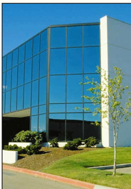
La gerencia de proyectos es un elemento indispensable en toda construcción.