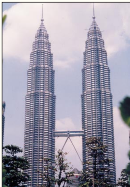
Torres Petronas, en Kuala Lumpur, las más altas del mundo, en cuya gestión de construcción participa Gerens Hill.