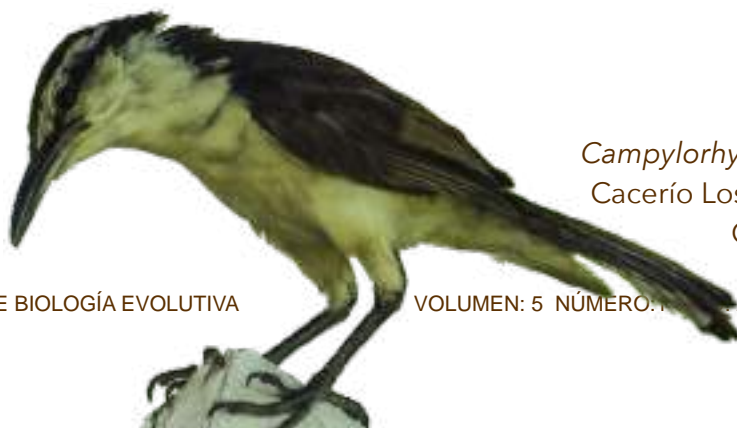
Campylorhynchus griseus , 2016 Cacerío Los Andes, Magdalena Gustavo Pisso Florez

El principal reto que enfrenta este tipo de estudios radica en que las poblaciones ancestrales ya no existen y todas las inferencias se hacen basadas en poblaciones que pueden o no representarlas adecuadamente. Es probable que estas poblaciones hayan divergido drásticamente debido a diferentes procesos evolutivos o que hayan coexistido con poblaciones extintas o no caracterizadas. Sólo a medida que se obtenga información genética más detallada y aumente la cobertura de los muestreos, se podrán inferir historias evolutivas y demográficas más cercanas a la realidad. Por el momento, se hace necesario una posición crítica y una valoración adecuada de las demás evidencias que se puedan obtener.