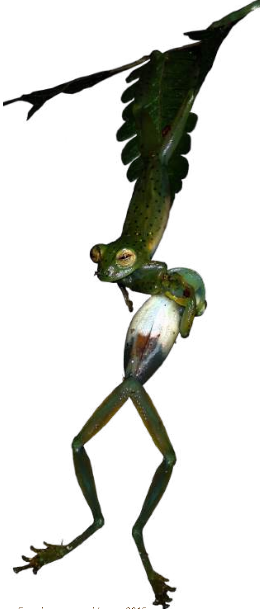
Espadarana prosoblepon, 2015 Armenia, Quindío