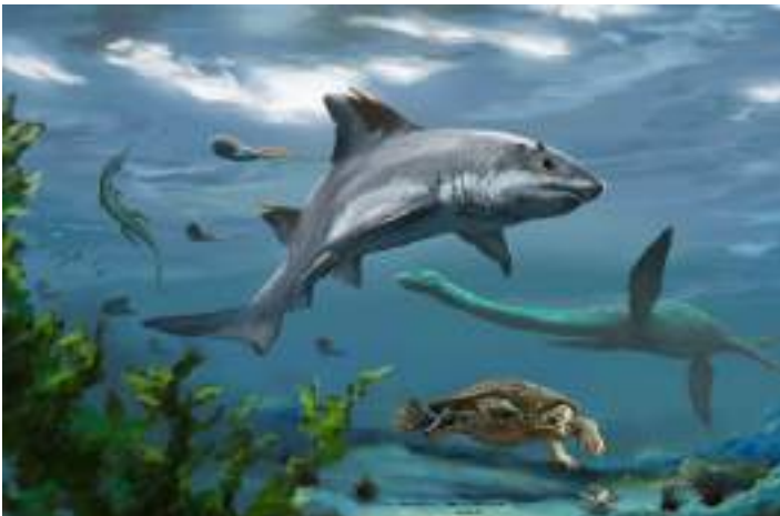
Por Jorge Blanco

El registro fósil de los condriictios del Mesozoico en el norte de Sudamérica es escaso y poco conocido. Carrillo-Briceño y colaboradores descubrieron dos espinas de la aleta dorsal de un tiburón Hybodontidae del Cretácico Inferior de Colombia en la Formación Rosablanca, Zapatoca, Santander. La presencia de amonitas, tortugas, plesiosaurios e ictiosaurios asociados a este condriictio sugieren que dicha zona se encontraba sumergida bajo el mar en ese entonces. Aunque la fragmentación de ambas