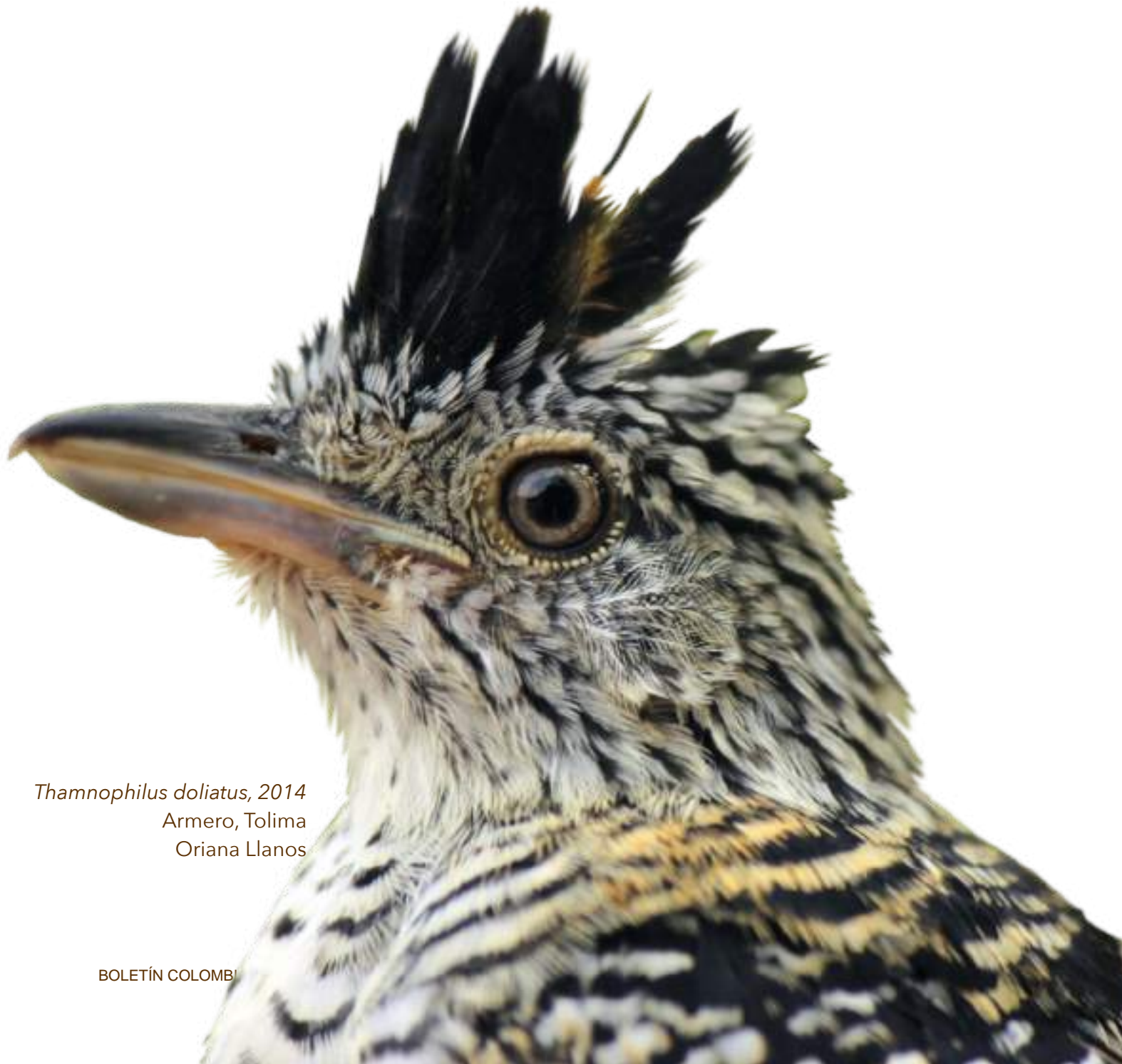
Thamnophilus doliatus , 2014 Armero, Tolima Oriana Llanos

¡Comprometámonos con promover la comprensión y la conciencia pública del papel que la ciencia desempeña como motor de transformación social en Colombia! La biología evolutiva tiene mucho que aportar en un país megadiverso y en proceso de recuperación tras una larga guerra.