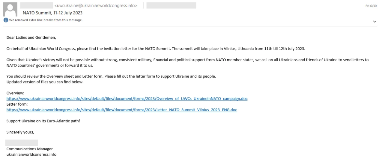
Imagen 3. Correo phishing del congreso mundial de Ucrania.

A mediados de junio de 2023, Storm-0978 inicio una campaña de phishing, haciendo uso de cargadores falsos de OneDrive, con la finalidad de desplegar un backdoor en los sistemas objetivo, cabe resaltar que dicho backdoor comparte algunas similitudes con RomCom. La campaña tiene como objetivo principal, entidades de gobierno en Europa y Norteamérica, y simulan ser documentos relacionados al congreso mundial de Ucrania.