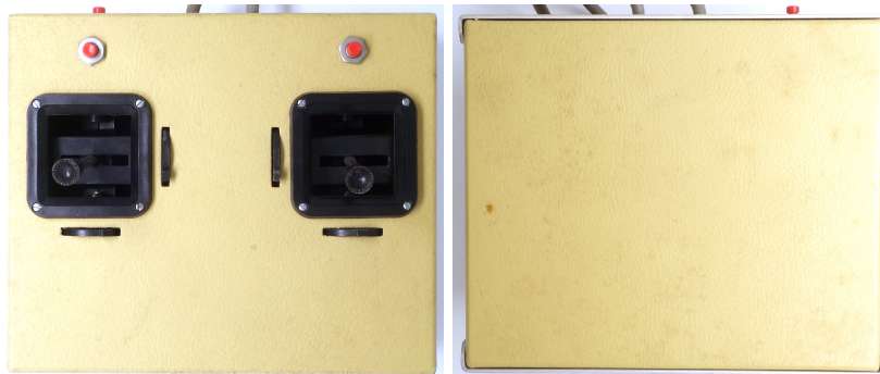
Рис. 2: Джойстик Dave Brown Dual joystick, вид сверху и снизу

Размер корпуса и эргономику можно оценить по рисункам 3 и 4.