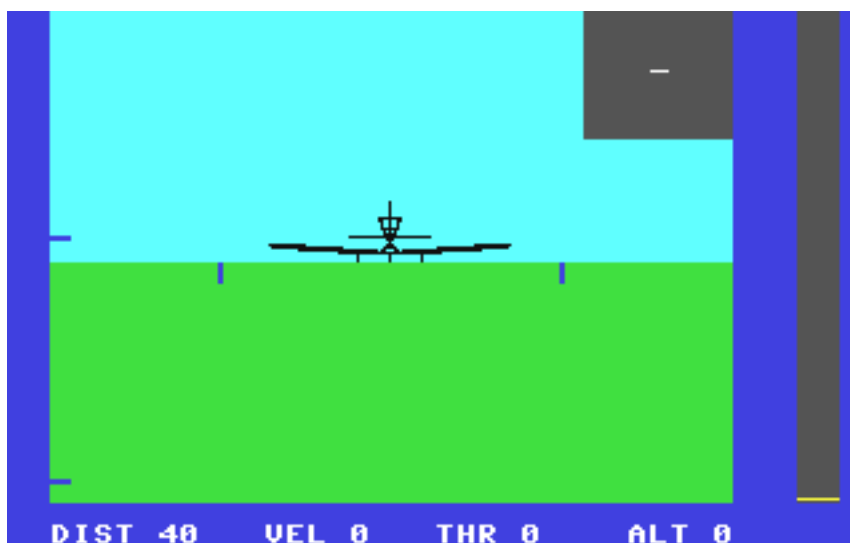
Рис. 5: Копия экрана R/C Flight Simulator