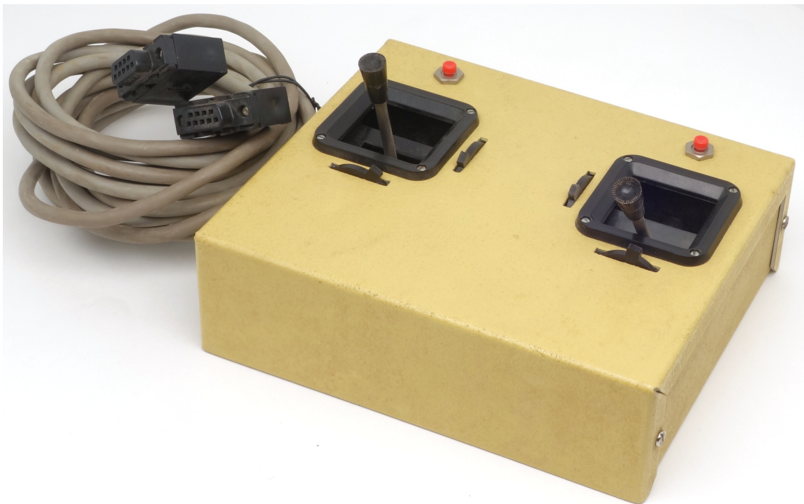
Рис. 1: Джойстик Dave Brown Dual

Джойстик Dave Brown Dual (рис. 1) — это вдвоенный двухосевой джойстик, копирующий внешний вид и конструктивные особенности пультов от радиоуправляемых моделей самолётов 80-х годов. Однако, вместо использования радиоинтерфейса, джойстик является проводным, созданным специально для программы-авиасимулятора Dave Brown RC Flight Simulator, написанной энтузиастом авиамоделирования Джоном Каллендом [1, 2]. Этот авиасимулятор был доступен на компьютерах Apple II и Commodore 64 в первой половине 1980-х годов, и еще дольше — на IBM-совместимых компьютерах (встречаются коробочные версии Dave Brown R/C Simulator 1995 года, укомплектованные данным джойстиком). В рамках симуляции джойстик позволяет контролировать параметры полёта, включая крен, тангаж, скорость и высоту, аналогично тому, как это реализовано в радиоуправляемых моделях. Согласно документации, джойстик имел собственное имя, «Transmitter» (от англ. «передатчик») [3].