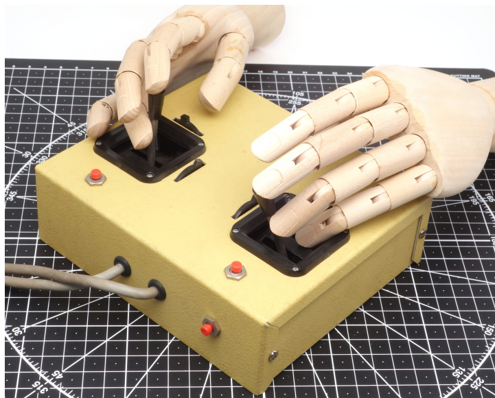
Рис. 4: Джойстик Dave Brown Dual с моделью руки человека