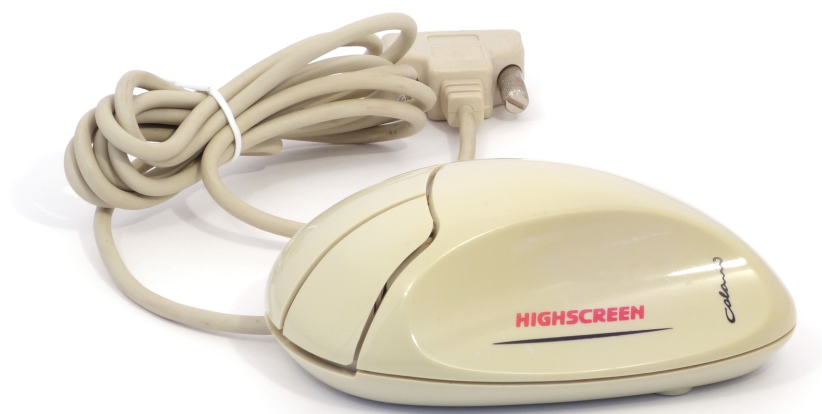
Рис. 1: Colani Mouse

Наибольшую известность Колани получил в области автоиндустрии, отметившись четырьмя десятками концепт-каров; не менее активно он проектировал мебель, предметы домашнего обихода, бытовую технику. Плодотворное сотрудничество Луиджи Колани с немецкой компанией Vobis Microcomputer, владельцем торговой марки Highscreen, привело к выпуску на основе его дизайна нескольких персональных компьютеров, джойстиков, мышей и трекболов.