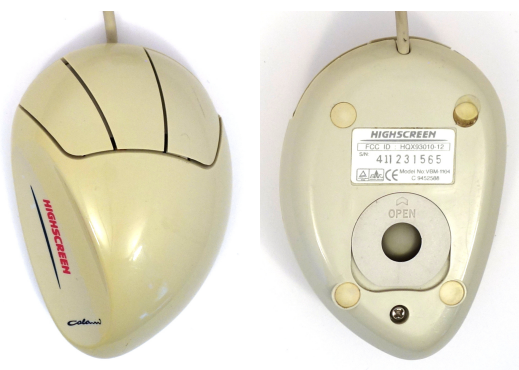
Рис. 2: Colani Mouse, вид сверху и снизу

Мышь HIGHSCREEN Colani Mouse, внешний вид которой показан на рис. 1 — представитель этой линейки. Данная модель мыши (вместе с трекболом Colani Trackball того же производителя, имевшим сходный дизайн) выиграла престижную премию «IF Design Award» проектной организации «iF International Forum Design GmbH» в 1993 году [2].