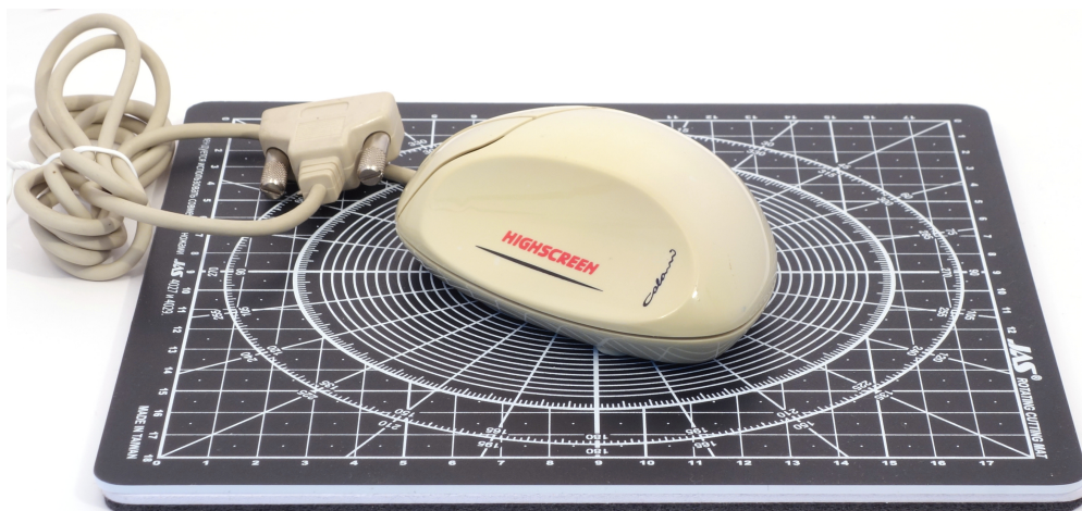
Рис. 3: Colani Mouse на размерном коврикe с шагом сетки 1 см

Как можно видеть на рис. 3, Colani Mouse является весьма компактным изделием, почти целиком помещающимся в ладони.