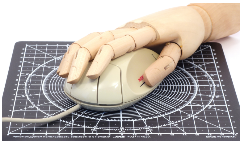
Рис. 4: Colani Mouse в комплекте с моделью руки человека