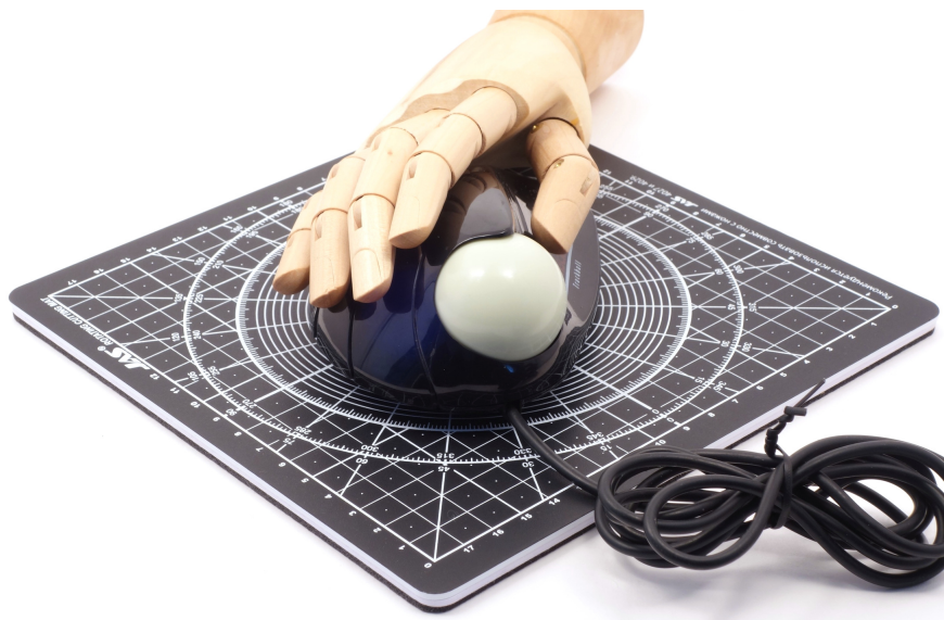
Рис. 4: Colani Trackball в комплекте с моделью руки человека