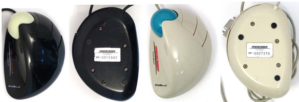
Рис. 2: Colani Trackball, вид сверху и снизу

манипуляторов (чего нельзя сказать, например, о кузовах автомобилей), так и популярность глиняных моделей со следами сжимавшей их руки, позволявших разработчику без больших сложностей получить анатомически-точное и необычное внешне изделие. Впрочем, судя по некоторым признакам, сам Луиджи Колани не прибегал к такому способу получения формы.