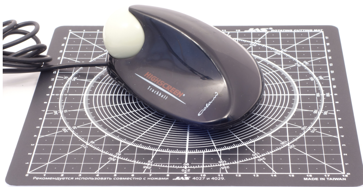
Рис. 3: Colani Trackball на размерном коврикe с шагом сетки 1 см

Как можно видеть на рис. 3 и 4, Colani Trackball является весьма компактным изделием, почти целиком помещающимся в ладони.