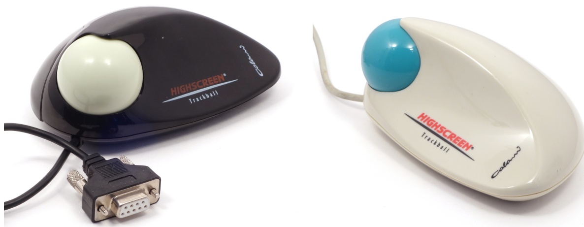
Рис. 1: Colani Trackball

Наибольшую известность Колани получил в области автоиндустрии, отметившись четырьмя десятками концепт-каров; не менее активно он проектировал мебель, предметы домашнего обихода, бытовую технику. Плодотворное сотрудничество Луиджи Колани с немецкой компанией Vobis Microcomputer, владельцем торговой марки Highscreen, привело к выпуску на основе его дизайна нескольких персональных компьютеров, джойстиков, мышей и трекболов.