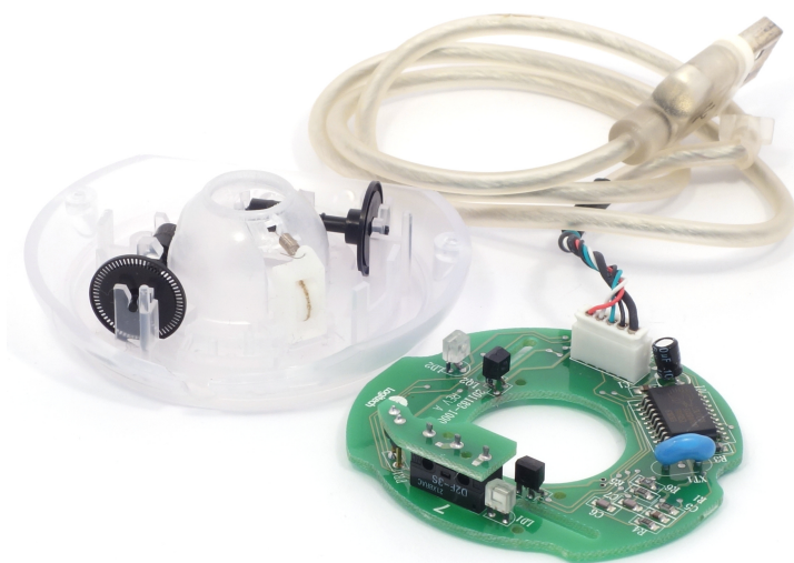
Рис. 6: Apple Puck Mouse, в разобранном виде

ямочку на корпусе мыши, чтобы помочь пользователям почувствовать, в каком направлении указывала мышь.