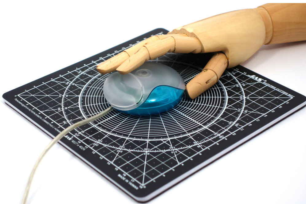
Рис. 4: Apple Puck Mouse с моделью руки человека

Это стало основной причиной успеха адаптеров-накладок, таких как iCatch Mouse Adapter [2], придававших мыши более продолговатую форму (рис. 5).