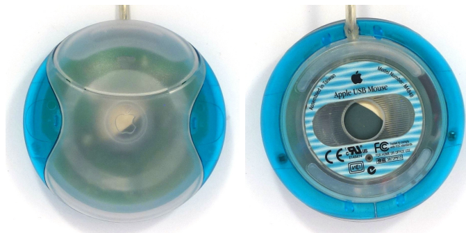
Рис. 2: Apple Puck Mouse, вид сверху и снизу

В отличие от большинства манипуляторов, эта мышь имеет круглую форму, и у нее есть одна кнопка, расположенная сверху, как и у предыдущих мышей Apple. При этом мышь имеет зазор между кнопкой и корпусом, показывающий, куда именно пользователь должен нажимать [1].