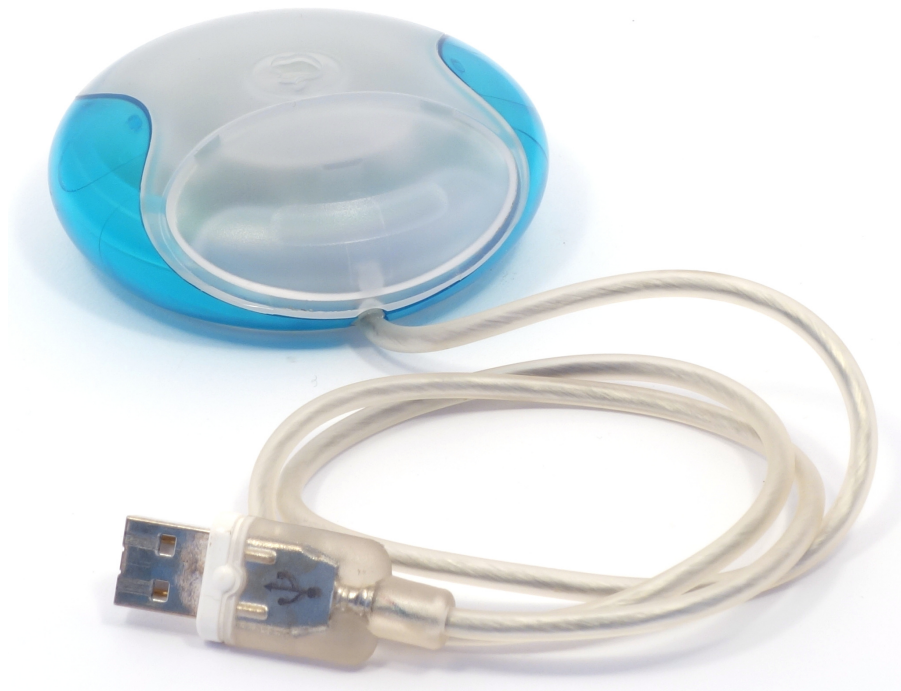
Рис. 1: Apple Puck Mouse

Мышь Apple USB mouse, часто называемая «шайбой» (англ. «puck») из-за своей необычной формы, была разработана компанией Apple в 1998 году. Это была первая коммерчески выпущенная мышь Apple mouse, которая использовала формат подключения USB, а не шину Apple ADB. Многие обозреватели критиковали данную мышь за ее недостаточно эргономичный дизайн.