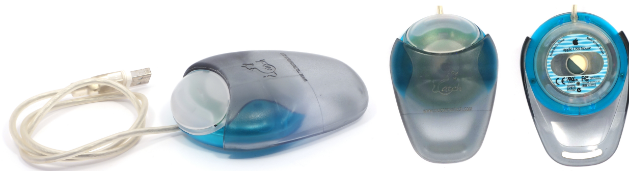
Рис. 5: Apple Puck Mouse, вид с накладкой

ямочку на корпусе мыши, чтобы помочь пользователям почувствовать, в каком направлении указывала мышь.