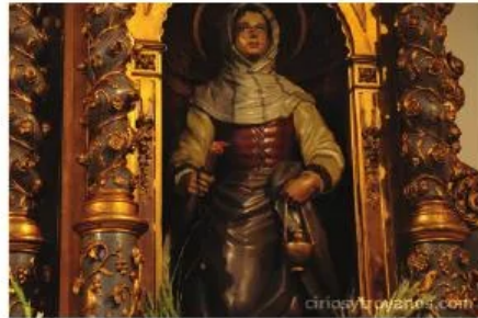
Santa María de la Cabeza, esposa de San Isidro Labrador. Real Colegiata.

En 1885, con la constitución de la diócesis de Madrid, pasó a ser la catedral provisional de esta ciudad, hasta 1993, cuando recuperó la categoría de colegiata.