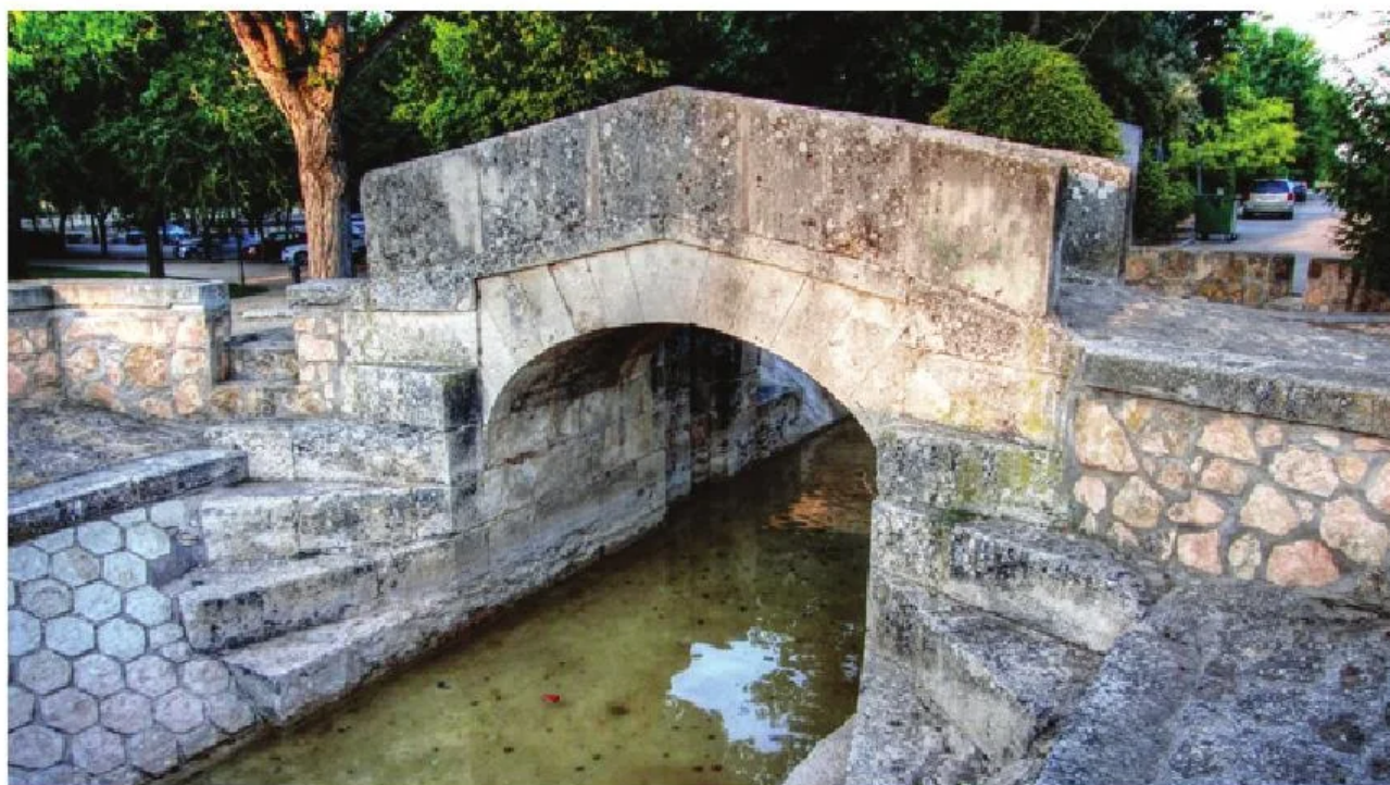
Puente del Gran Prior existente en Alameda de Cervera. Uno de los pocos restos que quedan del Canal.