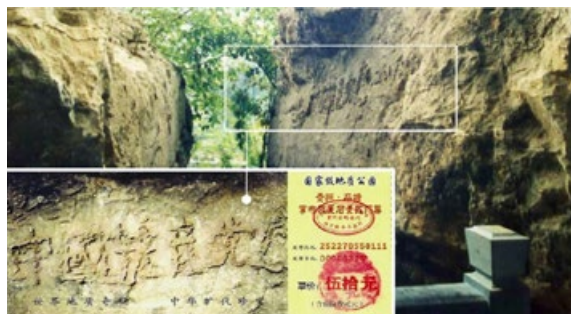
贵州平塘县藏字石惊现“中國共產黨亡”六个大字，小图为该景区门票。

过专题报道，但都隐去了最后一个字，还按照顺序排列，如此一个“亡”字。天然形成这六