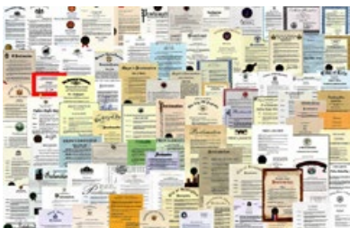
法轮功获得的部分褒奖

法轮功，也称法轮大法，是1992年5月13日由李洪志先生从长春传出的佛家上乘修炼功法，以宇宙特性“真、善、忍”为修炼原则，同时包含五套缓慢优美的功法动作。