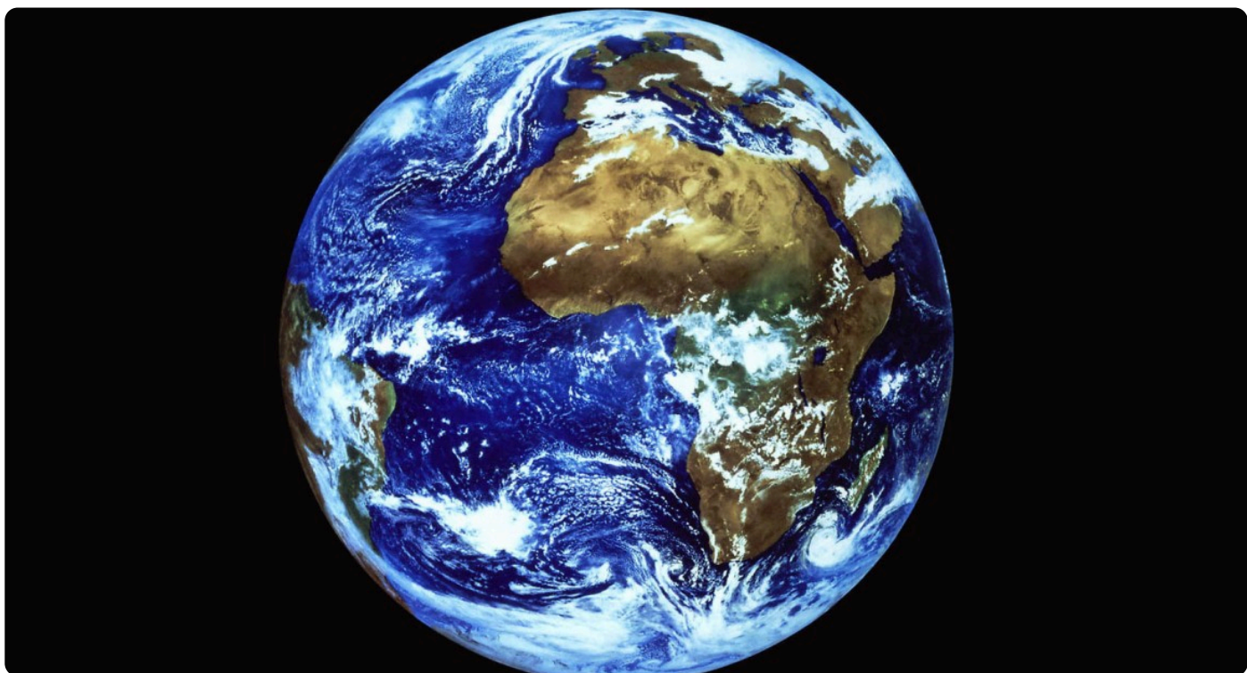
The Blue Marble, 2012