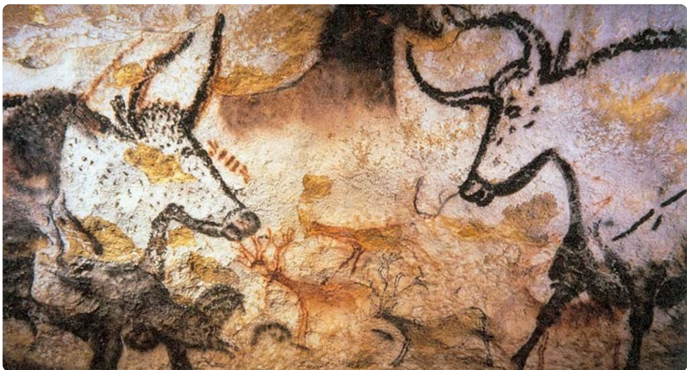
Graffito nelle grotte di Lascaux in Francia