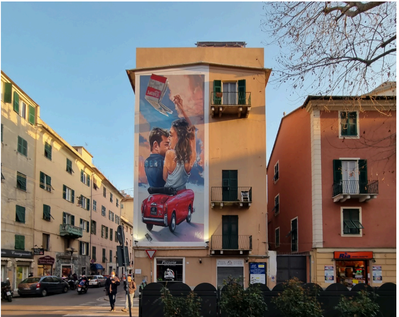
Il murale "Liberi di perderci" a Certosa (GE) di Antonello Piccinino in arte Maccs

Indovinate chi, la scorsa settimana, ci ha informato da Ginevra che là, a differenza dell'italia, ERA tutto tranquillo?