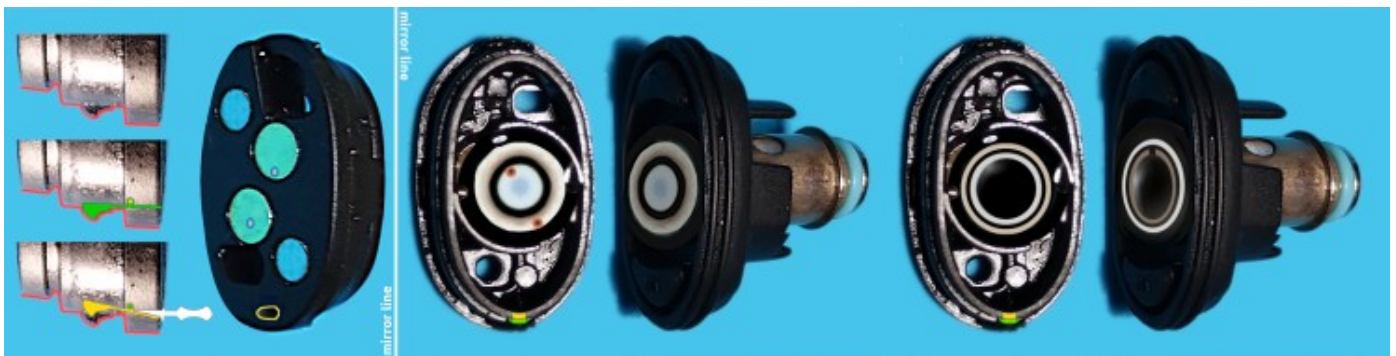
TSX pod alternative redesigns for standard coils and more similar to the original

Can we take in consideration to modify your Aspire TSX pods in such a way only the internal coil can be replaced, like in other your models? With the support of the producer or with the help of a 3D printing that provides a suitable alternativa TSX pod's bottom.