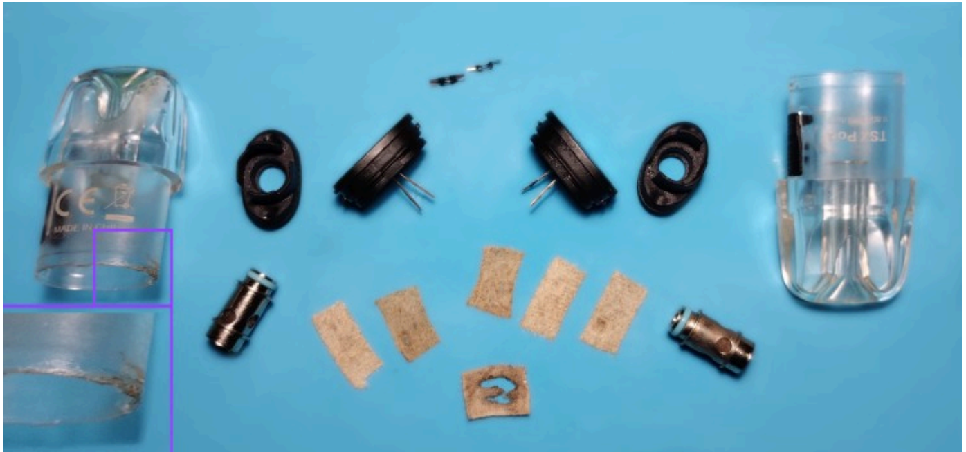
Due TSX pod disassemblati il cui interno è presentato su un tappetino di silicone

Infatti, per prima cosa mi sono cimentato a disassemblare completamente entrambe le Aspire TSX pod di risulta, di cui ormai la resistenza era esausta o addirittura rotta, per comprenderne i componenti interni e il loro assemblaggio.