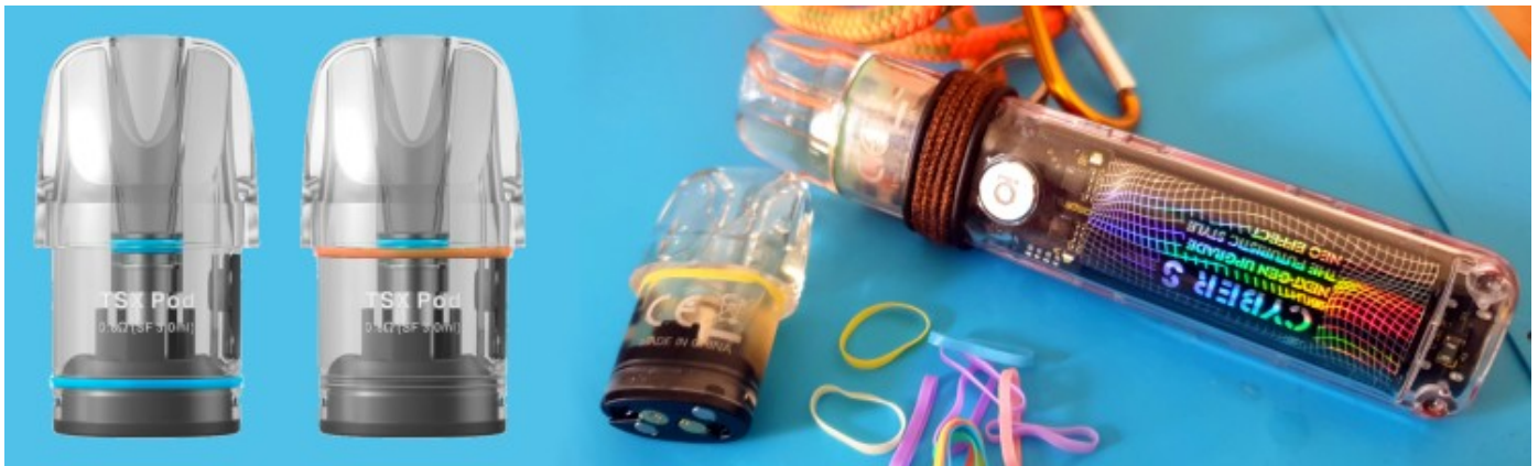
TSX quick mod for a better air-control: o-ring (pod-neck) + o-band (carry-strip)

Most of the air flow does not go through the holes provided but pass into the gap between the pod and the collar of the device housing it. This create a too big air-flow and drop considerably the control of the air-flow which leverages the pod orientation.