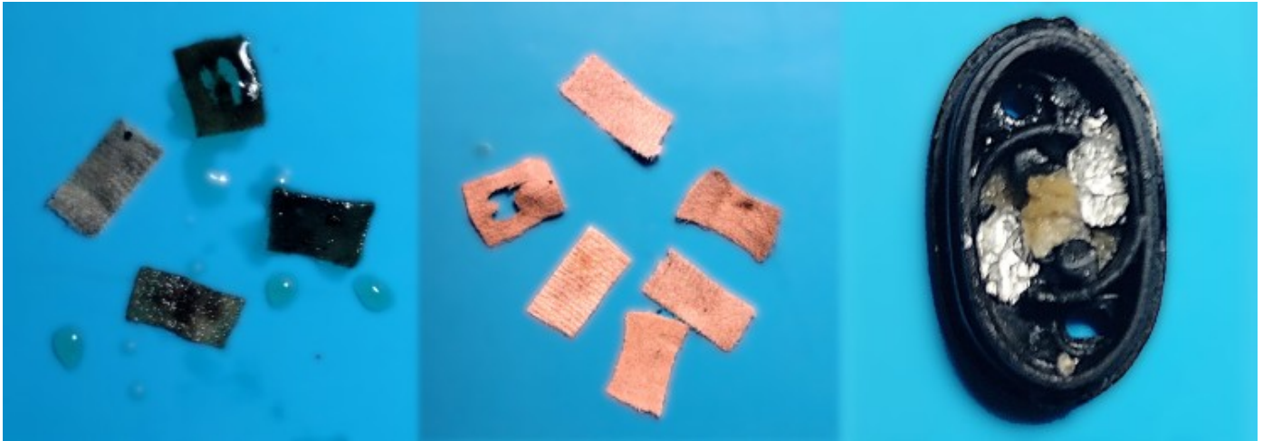
Pezze di cotone esausto, lavate e aree di contatto in foglia di alluminio.

Prima di passare alla costruzione della resistenza ho lavato i frammenti di cotone recuperati dal disassemblaggio delle pod. Invece per creare la connessione elettrica fra la coil e le placche sotto al fondo della pod ho creato del aree di contatto con la carta stagnola.