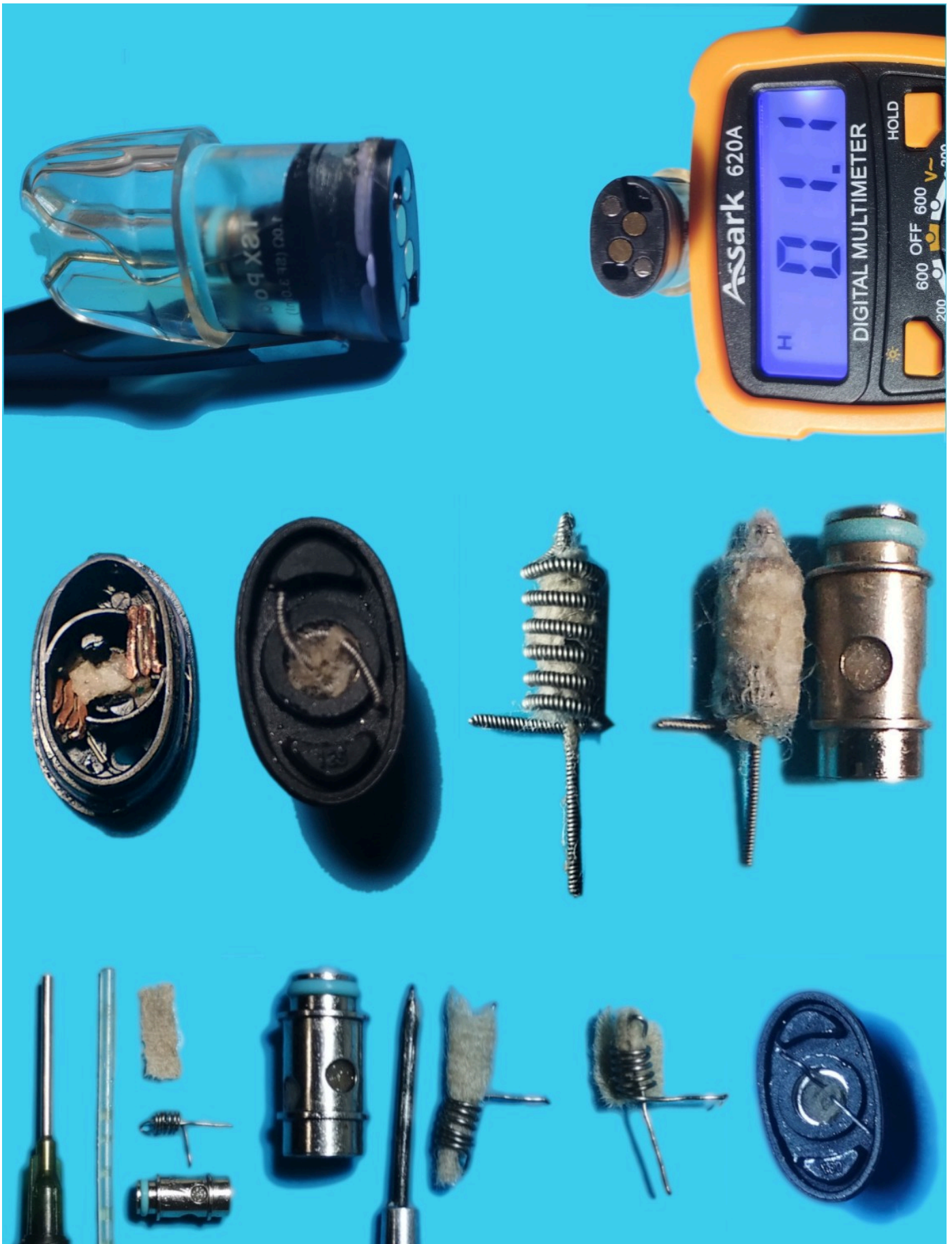
Strumenti, materiali, lavorazione, resistenze, TSX pod e misura degli Ohm