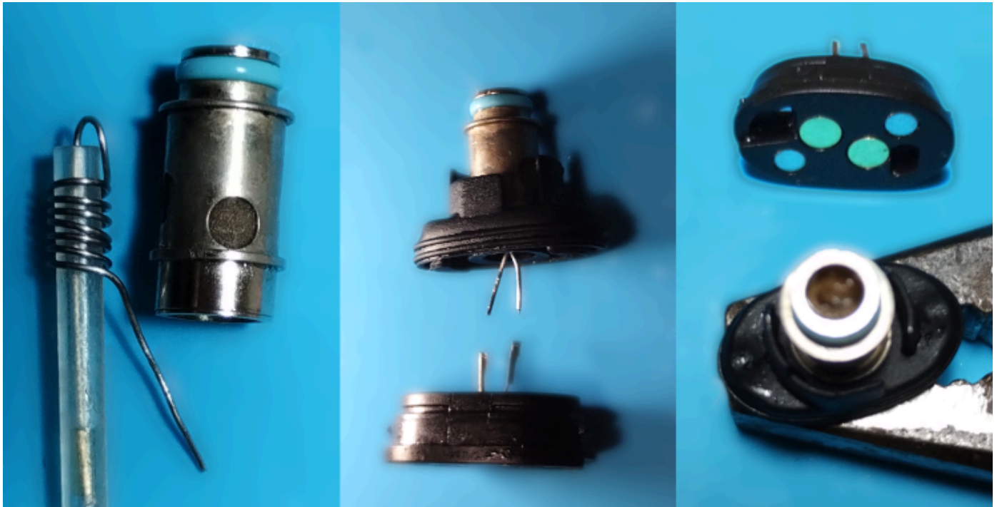
Risultato della prima prova di ricostruzione della coil interna al TSX pod

Però il filo resistivo sarebbe stato avvolto in qualcosa di più spesso quindi l'avvolgimento del filo di Pb+Sn aveva le stesse dimensioni di quello che poi sarebbe stato creato. Una caratteristica indispensabile per poter verificare la possibilità di inserire la resistenza nello scomparto di metallo.