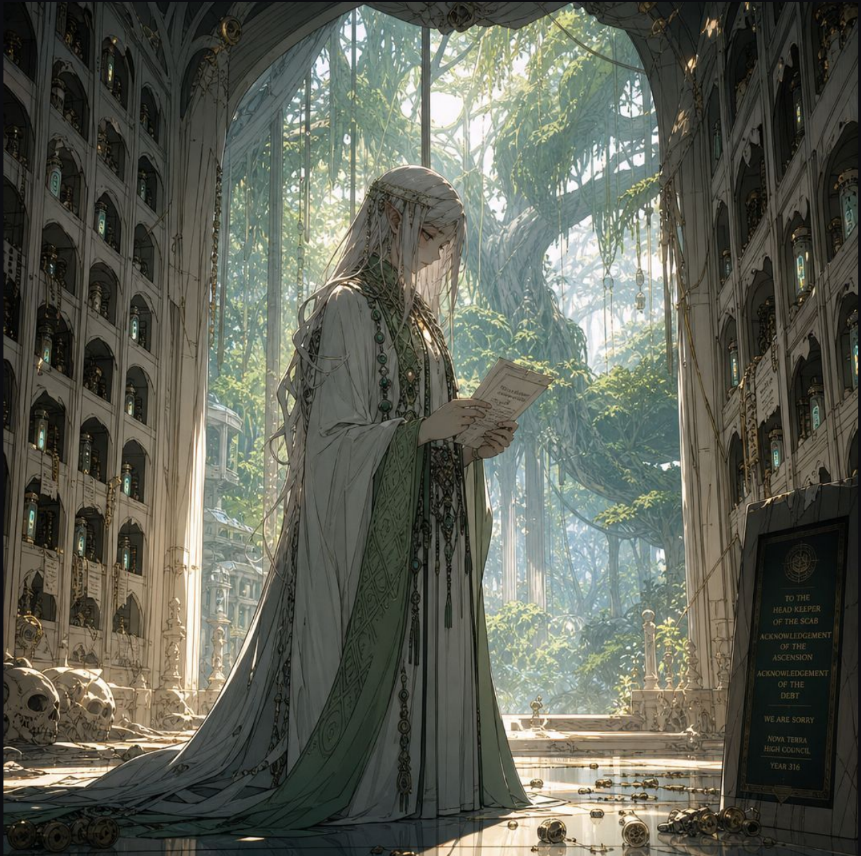
Ahnenhalle des Schattenschorfes. Die Oberhüterin erhält eine formelle Erklärung von Nova Terra: Anerkennung der Himmelfahrt, das Wort „Entschuldigung“, ausgesprochen 313 Jahre zu spät.