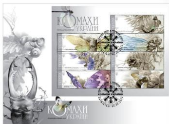
Ескіз-пропозиція маркового аркуша