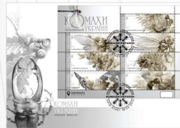
Затверджені оригінал-макету марок, маркового аркуша, конверта «Перший день» та штемпеля спецпоштового «Перший день»