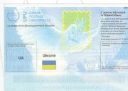
Міжнародні купони для відповіді "Стамбул"/2017