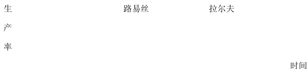
图 31-3 因为人事变动造成的生产损失

路易丝离开时生产力受到打击,甚至一度降至零以下,而团队其他人赶紧弥补失去一位契合良好的团队成员所造成的损失。然后生产力可能会回复到它以前的水平。