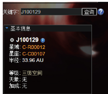
查询对面空间等级