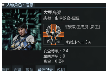
大豆-前虫洞作业教官

前虫洞作业领队。在榨干一个空间资源方面有着无人可比的效率，一个经验十足的教官。现主要作业区已不在虫洞，但仍可询问任何问题。